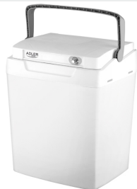
Portable cooler AD 8069