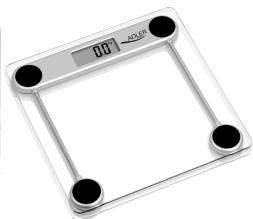
Bathroom Scale AD 8121