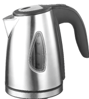
Kettle AD 1203