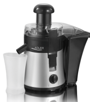
Juice Extractor AD 4106