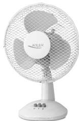
Table Fan AD 7302