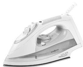
Steam Iron AD 5014