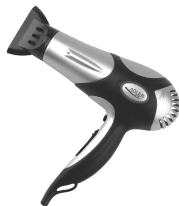
Hair Dryer AD 2224