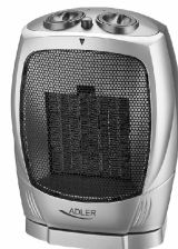
Fan Heater AD 7703