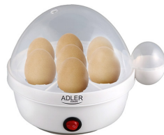
Egg boiler AD 4459