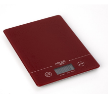
Electronic kitchen scale AD 3138